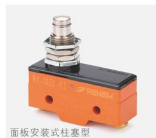
面板安装式柱塞型