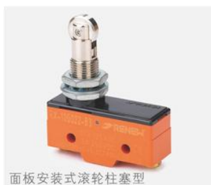
面板安装式滚轮柱塞型