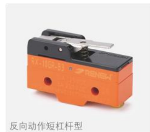
反向动作短杠杆型