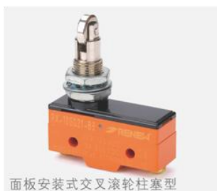
面板安装式交叉滚轮柱塞型