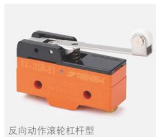
反向动作滚轮杠杆型