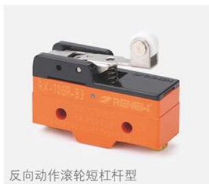
反向动作滚轮短杠杆型